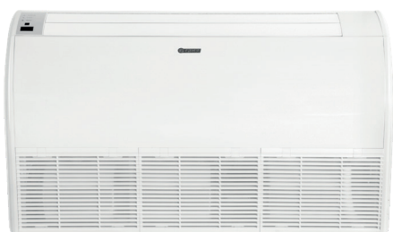
Sivulta puhaltava sisäyksikkö 70-A

GREEN kehittynyt invertteriteknikka mahdollistaa hyvän energiatehokkuuden. Nyt ympäristöystävällisellä R32 kylmäaineella.